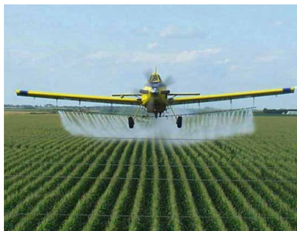
TRAUDT AERIAL SERVICE

La biodiversité du Cerrado de plus en plus déboisé est élevée. Il est à craindre que cette biodiversité soit détruite par les déforestations et les monocultures subséquentes, que des quantités de CO 2 très élevées soient libérées et que la capacité de rétention d'eau de la région soit réduite par la destruction des arbres et l'agriculture intensive et artificielle qui les remplace. Ces terres arables sont alors menacées à moyen terme d'érosion et d'infertilité. Tandis que la formation et la préservation d'un sol sain sont une tâche permanente et que la couche d'humus fertile ne pousse que d'un centimètre en cent ans, même avec une gestion hautement durable, les sols sont détruits par les monocultures et une agriculture artificielle en quelques décennies. Un quart des terres agricoles mondiales a maintenant moins d'humus et de nutriments qu'il y a 25 ans. Car avec l'érosion des terres qui ne sont pas cultivées durablement, 25 millions de tonnes de sols fertiles sont emportées tous les ans par le vent ou par les précipitations. On perd irrévocablement, chaque année, par l'érosion des terres arables, mais aussi par la surexploitation des pâturages et la construction sur 3 à 4 millions d'hectares