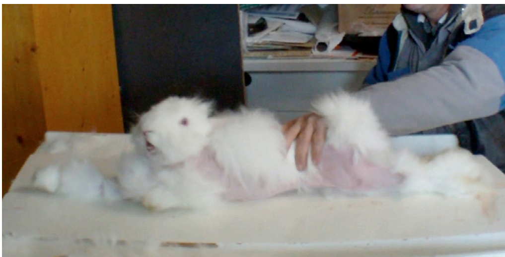
Le cri du lapin, aux vocalisations habituellement discrètes, est un signal de grande détresse...