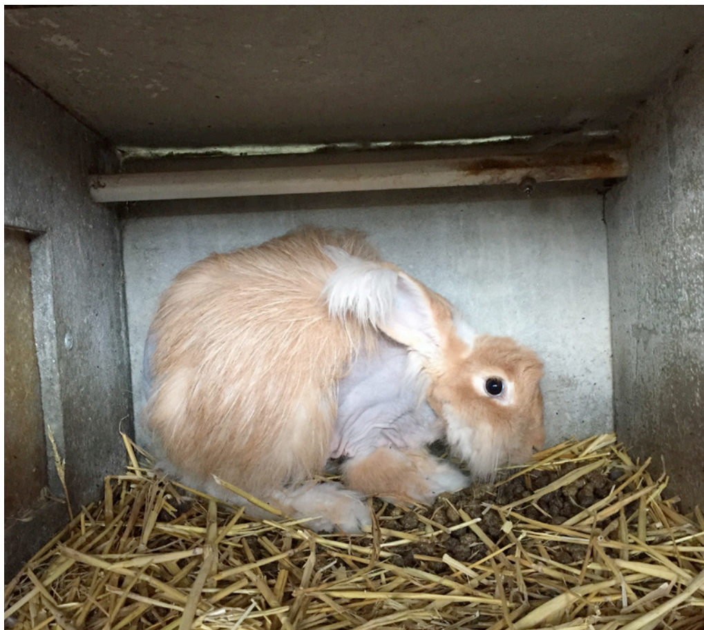
Les cages font en général 45 cm de hauteur pour 50 cm de large et 80 cm de profondeur.