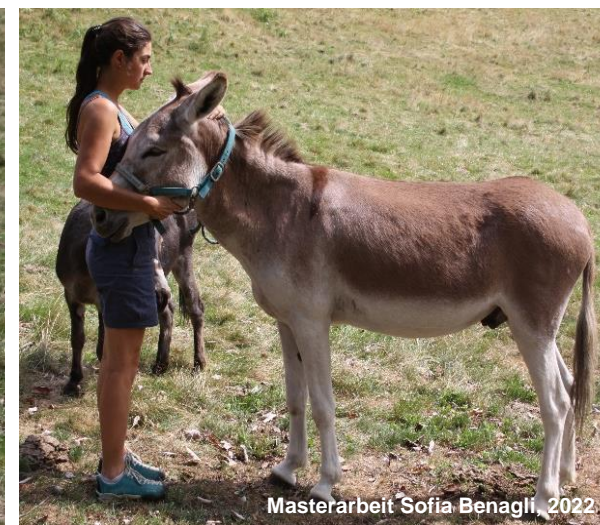
Image 15: Si la réaction de l'âne est facile à évaluer, cette manière d'immobiliser la tête de l'âne est également sûre.