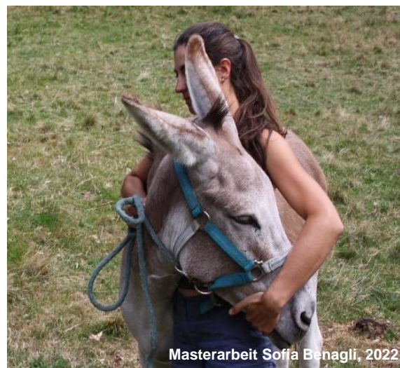
Image 14: Pour les ânes ou les situations imprévisibles, il est plus sûr de se tenir sur le côté de l'âne, au cas où il pousserait en avant.