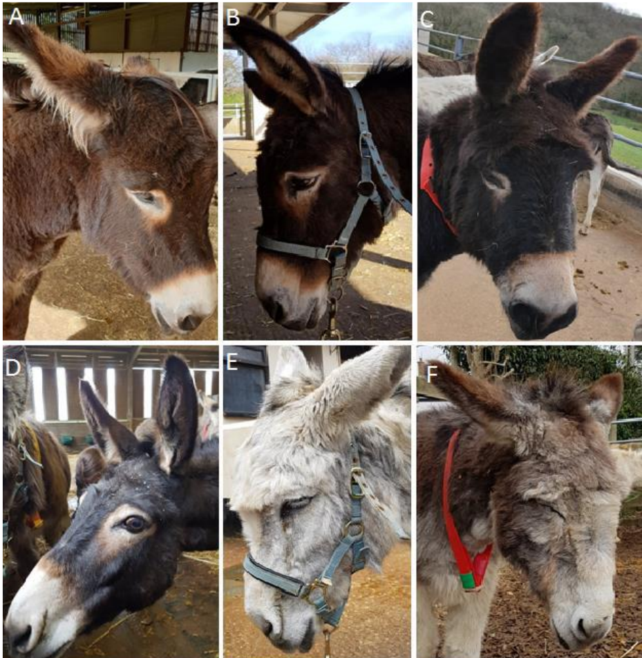
Abbildung 14: Beispiele für Gesichtsausdrücke von Eseln mit akuten Schmerzen: nach hinten gerichtete Ohren (A), stärker geöffnete Augenlider (B), deutliche geöffnete Nasenlöcher (C), deutlich geöffnete Augen mit sichtbarer Sklera (D), angehobene Mundwinkel (E), deutliche orbitale Anspannung der Augenlider (F).