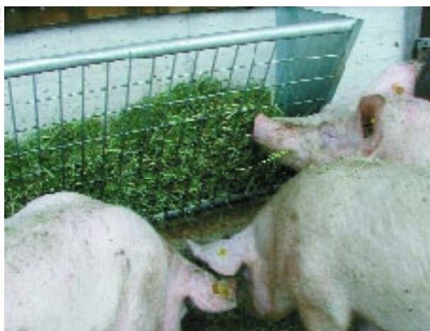
Les porcs se distraient à un râtelier rempli de paille ou de foin.