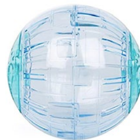
Balle pour hamster: terroriser l'animal.

Roues: les roues d'un diamètre trop petit (p. ex. 12 ou 15 cm de diamètre) peuvent causer des dommages à la colonne vertébrale des rongeurs. Les rayons ouverts sont un problème pour la sécurité – l'animal court le risque de rester accroché et de se blesser gravement. La PSA recommande donc d'utiliser des roues dont la surface d'utilisation est fermée. Elle recommande pour les souris et les hamsters nains des roues d'un diamètre égal ou supérieur à 20 cm, pour les hamsters dorés, les rats, les dègues et les gerbilles d'un diamètre égal ou supérieur à 30 cm et, enfin, pour les chinchillas d'un diamètre égal ou supérieur à 60 cm. Par ailleurs, les roues ne remplacent en aucun cas un enclos de taille généreuse, aménagé de manière variée.