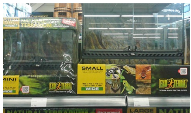
Les animaux figurant sur l'emballage des terrariums Exo Terra ne devraient pas y être détenus.