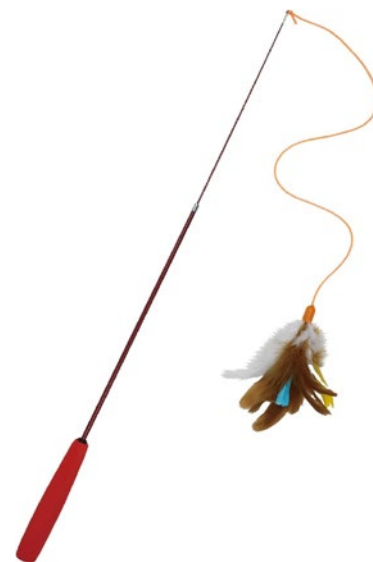
Canne à pêche pour chats

Jouets avec des plumes naturelles: les cannes à pêche ainsi que divers autres jouets pour chats ont souvent des plumes. Elles proviennent probablement de l'étranger. Il n'est pas du tout certain que ces oiseaux aient bénéficié de bonnes conditions de détention et d'une mise à mort respectueuse. Comme les fourrures, les plumes peuvent aussi contenir des polluants, surtout lorsqu'elles sont teintées.