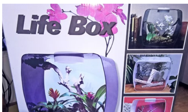
La Life Box est notamment aussi recommandée pour les reptiles, bien qu'elle ne permette nullement d'assurer un habitat adapté à l'espèce.

Life Box et Life Pyramide: «Définissez de nouveaux accents dans votre intérieur et utilisez les multiples possibilités que vous offre la Life Box. (...)» C'est ainsi que cet article est parfois prisé par le fabricant Lucky Reptile, en ligne et dans les animaleries. On trouve également la «Life Pyramide», d'une surface au sol de 30 x 30 cm, et d'une hauteur de 30 cm ou 45 cm. Une lampe LED avec diverses ampoules colorées (blanc, rouge, bleu, vert) est livrée à titre d'accessoire. Il est ainsi possible de choisir la couleur de la lumière ou de la faire alterner. Selon le fabricant, la Life Box/Life Pyramide convient aux animaux suivants: invertébrés tels qu'insectes, araignées et scorpions, escargots et certains batraciens, poissons combattants et reptiles. La PSA est en revanche d'avis que ces deux articles ne devraient pas être utilisés pour détenir des ani-