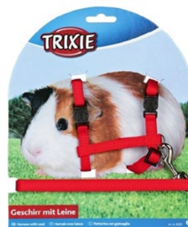
Harnais pour cochon d'Inde.

Balles de jogging/balles pour hamsters: il s'agit ici de balles en plastique transparentes pourvues d'une cavité intérieure creuse dans laquelle il est possible d'enfermer un hamster. Lorsque l'animal tente de se mouvoir ou de fuir, la balle commence à rouler et l'animal erre de manière incontrôlée dans la pièce. Le hamster ne peut pas sortir de la balle, il est livré sans défense à la situation, ce qui l'angoisse et l'effraie. Il risque par ailleurs de se blesser si la balle heurte un objet ou tombe. Ces balles ont pour unique but d'amuser le détenteur de l'animal aux dépens de celui-ci et sont de ce fait absolument à proscrire.