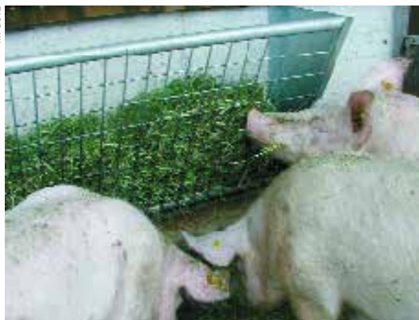
Les porcs se distraient à un râtelier rempli de paille ou de foin.