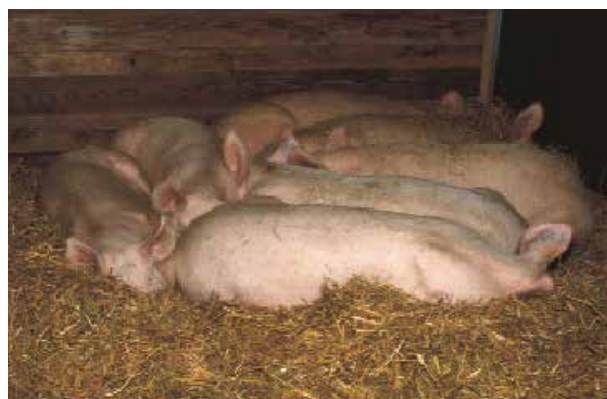
AGROSCOPE FAT TÄNKON

Ils se couchent au tendre, au sec et au chaud; c'est pourquoi en porcherie une litière de paille convient le mieux. S'il fait froid, ils se serrent les uns contre les autres et se tiennent chaud. En été, par contre, ils se couchent loin les uns des autres et ont alors besoin de davantage de place.