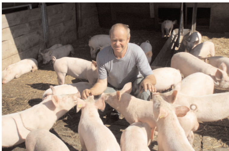
Les porcs qui se sentent bien ne se rongent pas la queue les uns les autres.

La coupe de la queue effectuée d'une façon routinière ne supprime pas les causes du rongage de la queue, mais empêche seulement les conséquences. Il s'agit donc d'une lutte contre les symptômes. Il est plus sensé de supprimer les causes du rongage de la queue, donc les facteurs qui déclenchent le trouble de comportement. Cela signifie que les animaux doivent avoir, tout le temps, du matériel frais d'occupation, comme de l'herbe, du foin ou de la paille. Ils doivent pouvoir manger et fouiller de longs moments ; ils doivent avoir une place de repos chaude et propre, avoir accès à un parcours et être vermifugés régulièrement. Si ces exigences de détention et de gestion sont respectées, l'apparition du rongage de la queue est évitée en grande partie.